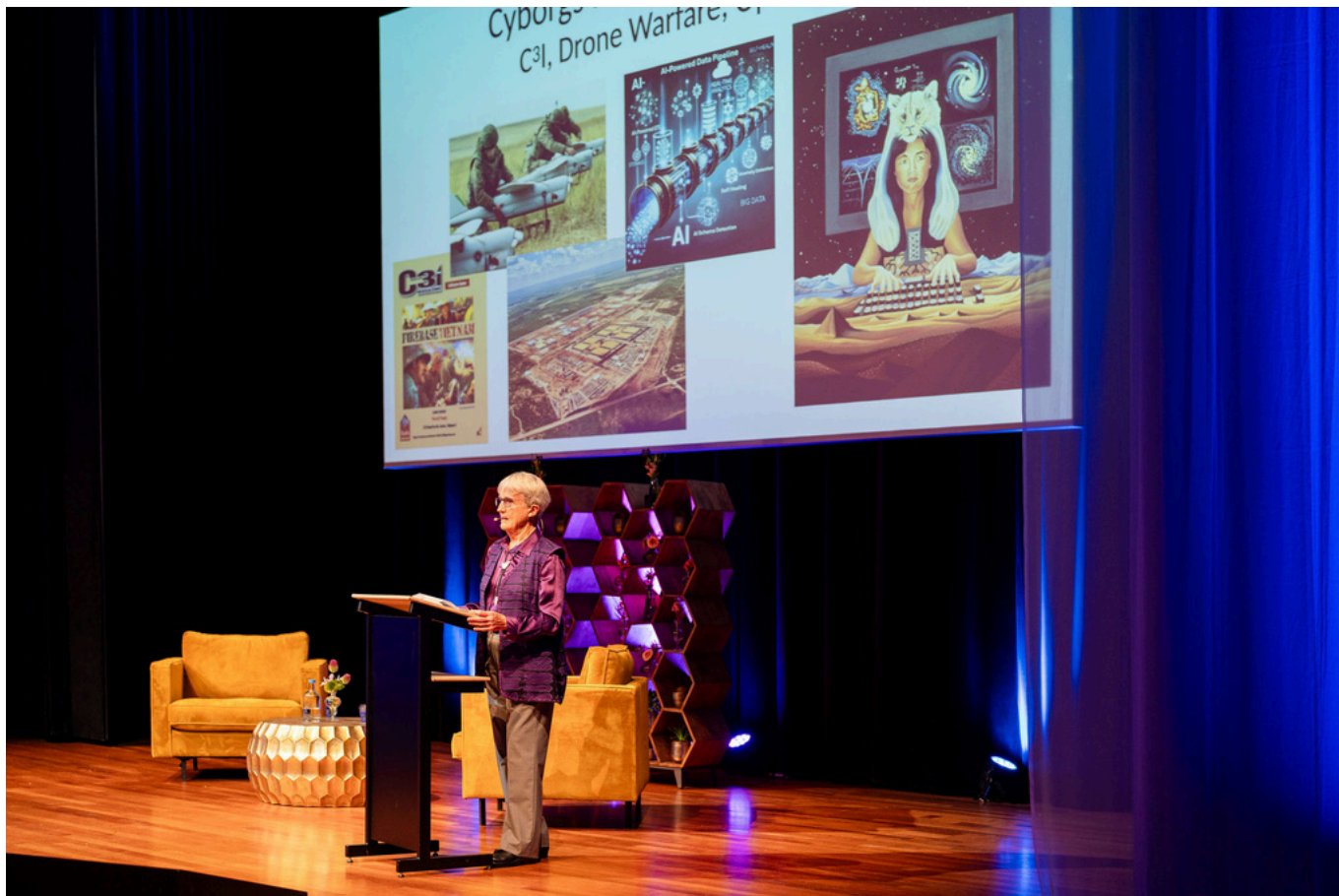
Donna Haraway geeft een lezing in het Next Nature Museum in Eindhoven.