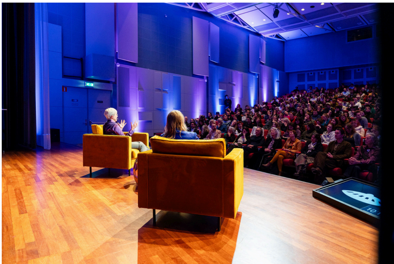
Q&A Donna Haraway en Stine Jensen in het Next Nature Museum in Eindhoven.